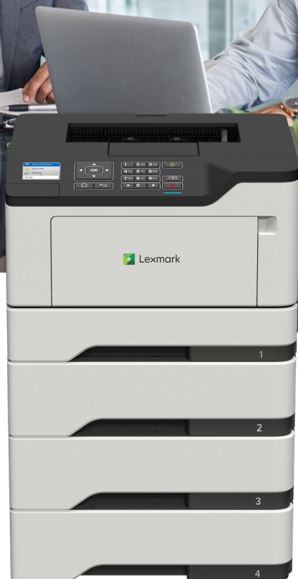
M1246 z opcjonalnymi tacami

Niezawodność. Bezpieczeństwo. Produktywność.