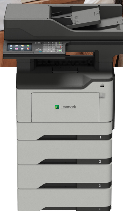
XM1246 z opcjonalnymi tacami

Niezawodność. Bezpieczeństwo. Produktywność.